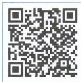
QR-Code แบบฟอร์มการขออนุญาต